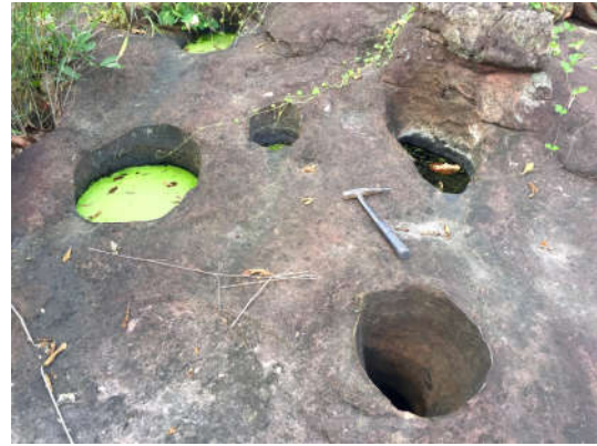
กุมภลักษณ์ที่เขาสามสืบสว่าง อ.สูงเนิน

ชุมชนโบราณแถบลำตะคอง เมื่อกว่า 1,300 ปีก่อน เป็นชุมชนสมัยทวารวดีที่นับถือพุทธศาสนา จึงมีหลักฐานของคูน้ำคันดินเมืองเสมา พระนอนหินทรายที่เก่าที่สุดในประเทศไทย และธรรมจักรศิลาหินทราย กับใบเสมาที่แกะสลักจากหินทรายที่บ้านหินตั้งนอกเมืองเสมา เมืองซึ่งคาดว่าเป็นศูนย์กลางของอาณาจักรศรีจนาศะ ต่อมาในสมัยขอมราว 1,000 – 800 ปีก่อน มีหลักฐานของปราสาทหินเมืองแขก-โนนภู-เมืองเก่า ที่ตำบลโคราษของอำเภอสูงเนิน โดยปราสาทหินเมืองแขกจัดเป็นศาสนสถานหินทรายชาวทวารวดีในศาสนาฮินดูหรือพราหมณ์ ใช้ปราสาทในการประกอบพิธีกรรมถวายแด่พระศิวะ ปัจจุบันมีการจัดงานประเพณี “กินเข่าค้ำ” ทุกปี