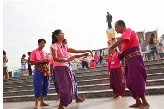
การแสดงเพลงโคราช

อุทยานธรณีโคราชโดยสรุป จึงหมายถึง พื้นที่ทางภูมิศาสตร์ของกลุ่มน้ำลำตะคองตอนกลางถึงตอนล่าง มีลักษณะภูมิประเทศและลักษณะทางธรณีวิทยาที่สำคัญในระดับนานาชาติ คือ เขาควงสตาหรือเขาอีโต้หินทรายในบริเวณขอบและใกล้ขอบที่ราบสูงโคราช กับฟอสซิลจำนวนมากและหลากหลายชนิด รวมทั้งนิเวศวิทยาป่าเต็งรังและวัฒนธรรมไทยโคราช ซึ่งพื้นที่และทรัพยากรดังกล่าว จะได้รับการอนุรักษ์และจัดการแบบบูรณาการโดยชุมชนท้องถิ่น เพื่อผลได้ทางเศรษฐกิจและสังคม ผ่านกิจกรรมการท่องเที่ยวเชิงธรณีอย่างยั่งยืน