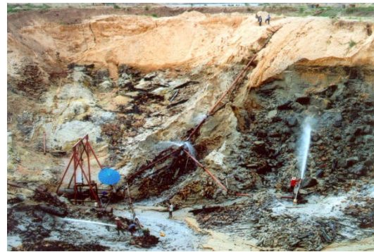
บ่อทรายที่มีฟอสซิลช้างดึกดำบรรพ์ ต.ท่าช้าง

ช้างดึกดำบรรพ์มากที่สุดในโลกถึง 10 สกุล จาก 55 สกุลที่พบทั่วโลก หรือร้อยละ 18 รวมทั้งสัตว์อื่นๆ เช่น แรด ฮิปโป ยีราฟคอสัน ม้าสามนิ้วฮิปโปเรียน อูรังอุตัง กวางแอนติโลป ซาลิโคเธอร์ หมูใหญ่ เมอร์โคโป-เทมัสควายโบราณ เสือเขี้ยวดาบ ไฮยีนา ตะโขง เต่ายักษ์ เป็นต้น จึงทำให้เกิดเครือข่ายอนุรักษ์และการท่องเที่ยว ทั้งที่พิพิธภัณฑ์ช้างดึกดำบรรพ์ ในตำบลท่าช้าง อำเภอเฉลิมพระเกียรติ พิพิธภัณฑ์ซากดึกดำบรรพ์ ที่ตำบลโคกสูง และโคราชไดโนพาร์คที่ตำบลโคกกรวด อำเภอเมืองนครราชสีมา