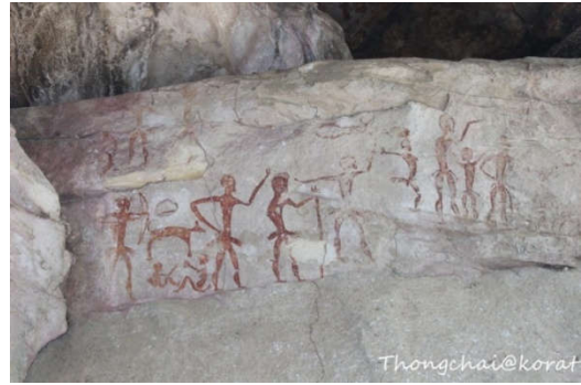
ภาพเขียนสีถ้ำเขาจันทน์งาม ต.ลาดบัวขาว อ.สีคิ้ว

ผ่านประตูที่ราบสูงไปตามถนนมิตรภาพ พื้นที่ลาดทางด้านตะวันออก ในเขตตำบลคลองไผ่ เป็นแหล่งผลิตและจำหน่ายผลิตภัณฑ์จากหินทรายในท้องถิ่นใหญ่ที่สุดและหลากหลายรูปแบบที่สุดของประเทศ ขณะที่พื้นที่ลาดเขาทางด้านตะวันออกอีกแห่งหนึ่ง มีโขดหินโผล่และเพิงผาของหินทราย ชื่อถ้ำเขาจันทน์งาม มีภาพเขียนสีของชาวโคราชโบราณเมื่อ 3-4 พันปีก่อน ที่บ่งบอกวิถีชีวิตเก็บของป่าล่าสัตว์ และพิธีกรรมในยุคหินใหม่ ส่วนบริเวณสันเขาที่ทอดยาวไปทางตะวันออกเฉียงใต้มียอดเขาเขาสตาที่สูงกว่า 700 เมตร เป็นที่ตั้งของเจดีย์และวัดป่าภูผาสองที่ถ้ำลิงการ สวยงาม และพยายามอนุรักษ์สิ่งแวดล้อมให้คล้ายกับธรรมชาติเดิม