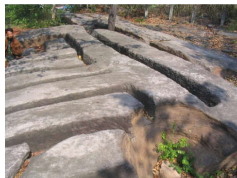
แหล่งหินตัดสีคิ้ว

พื้นที่ถัดจากแนวขอบที่ราบสูงไปทางตะวันออกระยะทางประมาณ 10 กิโลเมตรเศษ มีแนวเขาเขาสตาอีก 1 แนว ขนานกับแนวแรก และถูกซอยแบ่งเป็นเขาโดดหินทรายที่ด้านทาน ลักษณะหิน อายุ และสัณฐานภูมิประเทศเหมือนเนินเขาแถบภูพานในจังหวัดกาฬสินธุ์ ในทางธรณีวิทยาจึงเรียกว่าหมวดหินภูพาน นับเป็นเนินเขาใกล้แหล่งชุมชนโบราณแถบริมลำตะคองและริมแม่น้ำมูลมากที่สุด จึงปรากฏร่องรอย