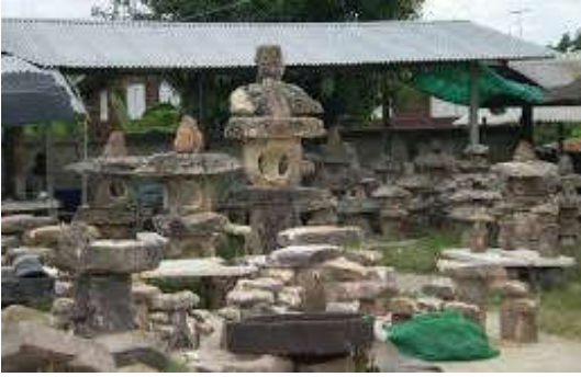
แหล่งแกะสลักหินทรายบ้านหนองบัว ต.คลองไผ่ อ.สีคิ้ว