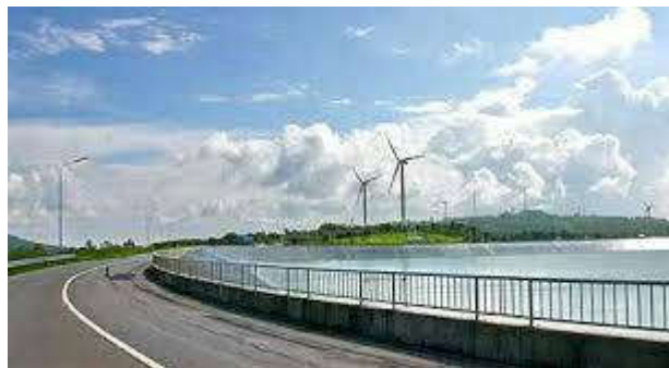
วิวอ่างพักน้ำตอนบน

ขึ้นไปทางตะวันออกตามทิศทางการเอียงเทของชั้นหิน ลักษณะคล้ายกับเขาพระวิหารทั้งเนื้อหินและภูมิประเทศ ในทางธรณีวิทยาจึงเรียกชุดชั้นหินนี้ว่าหมวดหินพระวิหาร มีความต้านทานสูง จึงคงทนต่อการสึกกร่อนและคงเหลือเป็นภูเขาที่ข้างหนึ่งชันข้างหนึ่งลาด สูงจากระดับน้ำทะเลปานกลาง 400 ถึง 700 กว่าเมตร ขณะที่ภูมิภาพที่เห็นทางด้านตะวันตกในเขตอำเภอปากช่องหรือมวกเหล็ก จะเห็นภูเขาหินปูนยอดขยุกขยิกเพราะการละลายได้จากน้ำฝน วิถีชีวิตของผู้คนใน 2 พื้นที่นี้จึงแตกต่างกัน