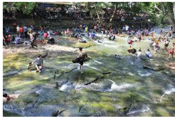
น้ำตกวังเณร ต.มะเกลือเก่า

แหล่งท่องเที่ยวและเรียนรู้ประเภทแหล่งแร่ มีแหล่งเกลืออยู่ในบริเวณทางเหนือของอำเภอเมือง นครราชสีมาและอำเภอลำทะเมนชัย โดยเฉพาะแหล่งเกลือที่ตำบลหนองสรวง การผลิตเกลือโดยกรรมวิธีสูบน้ำบาดาลเค็มมาขังในแปลงนาตาก แล้วปล่อยให้ระเหย ทำให้พบว่ามีลำดับการตกผลึกตั้งแต่เกลือแคลเซียม เกลือโซเดียม และเกลือแมกนีเซียม เหมือนการตกผลึกจากน้ำทะเล ย่อมแสดงว่า ภาคอีสานเคยเป็นแอ่งแผ่นดินที่มีน้ำทะเลเข้ามาท่วมขังและระเหยแห้งมาก่อน