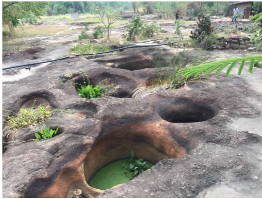
กุมภลักษณ์หรือหลุมรูปหม้อที่เขาเหิบ อ.สีคิ้ว

ของการสกัดหินในแหล่งหินตัดสร้างปราสาทหินเมื่อกว่า 1,000 ปีก่อน ในเขตตำบลมิตรภาพของอำเภอสีคิ้ว รวมทั้งมีร่องรอยการกระทำของน้ำไหลบนเนินเขาเหิบ ที่เรียกว่าหลุมรูปหม้อหรือกุมภลักษณ์นั้นบรื้อยหลุม ตั้งแต่ขนาดเล็กจนถึงขนาดเส้นผ่านศูนย์กลางมากกว่า 2 เมตร ลักษณะดังกล่าวนี้ยังปรากฏให้เห็นใน เขาเขาสตาลูกอื่นๆ ที่อยู่ในแนวเดียวกัน เช่น ที่เขาสามสืบสว่าง ในตำบลมะเกลือเก่า