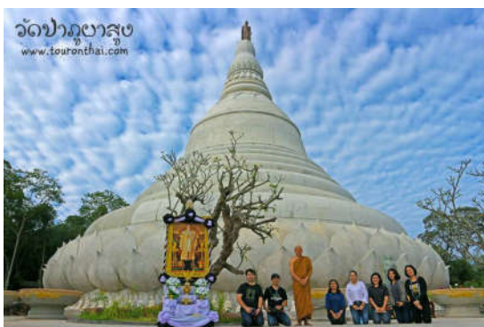
พระธาตุจอมผา วัดป่าภูผาสอง

พื้นที่บนภูเขา ลาดเขาของขอบที่ราบสูง ไปจนถึงที่ราบลูกคลื่น และที่ราบทางตะวันออกสุดของอุทยานธรณีโคราช เป็นระบบนิเวศของป่าเต็งรัง ที่มีไม้เด่น คือ เต็ง รัง พลวง เหียง ยางกรวดและอื่นๆ อีกนับร้อยชนิด โดยมีแหล่งเรียนรู้ ท่องเที่ยวทัศนศึกษาที่สำคัญของอุทยานธรณี 2 แห่งด้วยกันคือ ศูนย์อนุรักษ์พันธุกรรมพืชฯ คลองไผ่ อำเภอสีคิ้ว และโครงการอนุรักษ์พันธุกรรมพืชฯ หนองระเวียง อำเภอเมืองนครราชสีมา