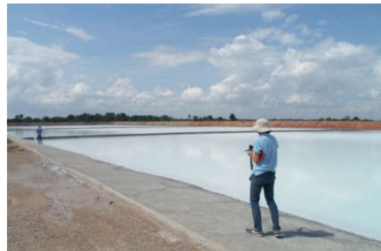
นาเกลือ ต.หนองสรวง

แหล่งท่องเที่ยวประเภทซากดึกดำบรรพ์ เป็นแหล่งท่องเที่ยวที่เป็นเอกลักษณ์และอัตลักษณ์ของ อุทยานธรณีโคราช ทั้งนี้เป็นเพราะด้วยความเป็น “มหานครแห่งบรรพชีวิน” หรือ “พาลีออนโตโพลิส” (Paleontopolis) ของนครราชสีมา และการกำเนิดฟิสิธันท์ไม้กลายเป็นหิน ช้างดึกดำบรรพ์ และไดโนเสาร์ มากกว่า 10 ปี ณ บ้านโกรกเดือนห้า ตำบลสุรนารี อำเภอเมืองนครราชสีมา ซึ่งพื้นที่ตำบลนี้และตำบลใกล้เคียง คือ ตำบลโคกกรวด ตำบลโป่งแดง เป็นแหล่งใหญ่ทั้งซากดึกดำบรรพ์ไม้กลายเป็นหิน และไดโนเสาร์รวมทั้ง ผองเพื่อนร่วมยุค ประการสำคัญ คือ ซากดึกดำบรรพ์สัตว์เลี้ยงลูกด้วยนมอายุ 16 ล้านปีถึงหนึ่งหมื่นปีก่อนของ อำเภอเมืองนครราชสีมา และโดยเฉพาะจากแหล่งบรรจุล้าตะกองกับแม่น้ำมูลในอำเภอเฉลิมพระเกียรติที่พบ