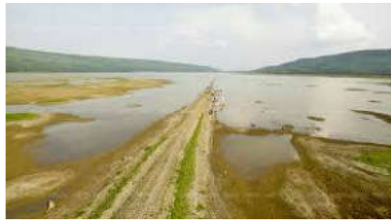
ประตูสู่ที่ราบสูงโคราชตามทิศทางถนนมิตรภาพเก่า

การเดินทางท่องเที่ยวจากส่วนกลางของประเทศ ผ่านอำเภอปากช่องและเข้าสู่ประตูที่ราบสูงโคราชที่แท้จริง ย่อมเป็นช่องเขาระหว่างเขายายเที่ยงกับเขาขนานจิต ซึ่งมีทั้งถนนมิตรภาพ ทางรถไฟ ท่อก๊าซ และลำตะคองตัดผ่าน รวมทั้งเป็นทำเลที่ตั้งเขื่อนลำตะคองที่ส่งน้ำหล่อเลี้ยงชาวอุทยานธรณีโคราชกว่าเจ็ดแสนคน จุดชมวิวยามเขายายเที่ยงบริเวณอ่างพักน้ำตอนบนและผายายเที่ยง เป็นจุดที่เห็นผาชันของที่ราบสูงโคราชทางด้านทิศเหนือที่ถูกขอยแบ่งเป็นเขาเขาสตาหรือเขาไต้หินทราย ซ้อนๆ ต่อเนื่องกันไป และจะเห็นด้านลาด