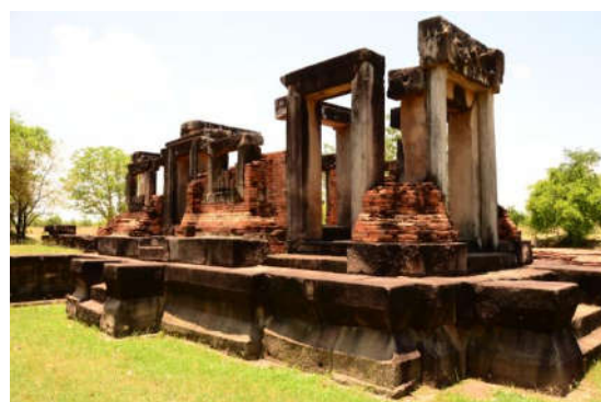
ปราสาทเมืองแขก อ.สูงเนิน

แหล่งท่องเที่ยวประเภทน้ำตกในอุทยานธรรมมีหลายแหล่ง สัมพันธ์กับชั้นหินทรายที่ด้านทานและ ไม่ด้านทาน แต่มักมีน้ำตกเฉพาะฤดูฝน เช่น น้ำตกวะภูแก้ว ตำบลมะเกลือใหม่ ยกเว้นน้ำตกตามร่องน้ำใน ลำตะคอง เช่น น้ำตกวังเณร ในตำบลมะเกลือเก่า ซึ่งเป็นน้ำตกที่ชาวเมืองนครราชสีมานิยมไปเที่ยวกันมาก