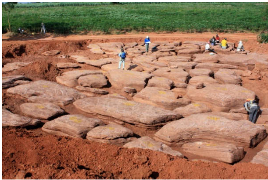
บ่อหินที่มีฟอสซิลไดโนเสาร์ ต.สุรนารี