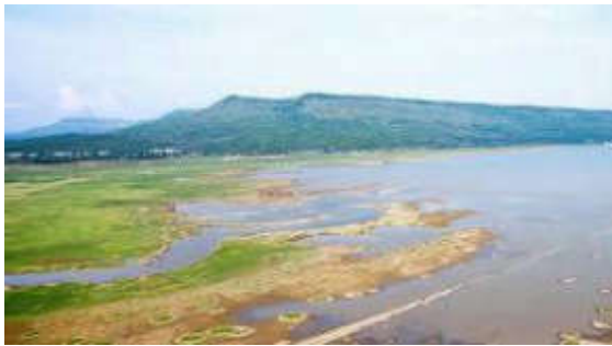
เขาสตาเขาขนานจิต ตรงข้ามเขายายเที่ยง

แต่สิ่งที่เป็นความพิเศษเฉพาะพื้นที่ (Unique) ในทางธรณีวิทยา คือ ฟอสซิลไดโนเสาร์และสัตว์ร่วมยุคจำนวนมากและหลากหลายชนิดในชั้นหินกรวดมนปนปูนที่แทรกสลับชั้นอยู่กับหินทราย ในเขตอำเภอเมืองฯ และฟอสซิลช้างดึกดำบรรพ์และสัตว์ร่วมยุค รวมทั้งไม้กลายเป็นหินที่สะสมตัวอยู่ในชั้นตะกอนร่วนกรวดทราย ในเขตอำเภอเฉลิมพระเกียรติและอำเภอเมืองนครราชสีมา จนอาจกล่าวได้ว่า เมืองโคราช คือ มหานครแห่งบรรพชีวิน หรือพาลีออนโตโพลิส ของโลก นอกจากนี้ ในด้านนิเวศวิทยาของพื้นที่ ระบบนิเวศวิทยาป่าเต็งรังถือว่า มีความโดดเด่นกว่าป่าประเภทอื่นๆ ส่วนด้านวัฒนธรรมของพื้นที่และผู้คนส่วนใหญ่ที่เด่นและแตกต่างจากอุทยานธรณีอื่นๆ คือ วัฒนธรรมไทยโคราช ดังนั้น เมื่อนึกถึงอัตลักษณ์อุทยานธรณีโคราช ก็สมควรที่จะนึกถึง “ดินแดนแห่ง 1 เขา 1 หิน 1 ป่า 1 ลำน้ำ 1 วัฒนธรรม กับ 3 ซาก !?” ที่จะกล่าวถึงต่อไปนี้