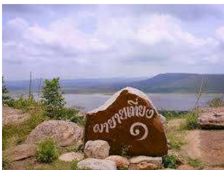
วิวจากผายายเที่ยง

การเดินทางท่องเที่ยวจากส่วนกลางของประเทศ ผ่านอำเภอปากช่องและเข้าสู่ประตูที่ราบสูงโคราชที่แท้จริง ย่อมเป็นช่องเขาระหว่างเขายายเที่ยงกับเขาขนานจิต ซึ่งมีทั้งถนนมิตรภาพ ทางรถไฟ ท่อก๊าซ และลำตะคองตัดผ่าน รวมทั้งเป็นทำเลที่ตั้งเขื่อนลำตะคองที่ส่งน้ำหล่อเลี้ยงชาวอุทยานธรณีโคราชกว่าเจ็ดแสนคน จุดชมวิวยามเขายายเที่ยงบริเวณอ่างพักน้ำตอนบนและผายายเที่ยง เป็นจุดที่เห็นผาชันของที่ราบสูงโคราชทางด้านทิศเหนือที่ถูกขอยแบ่งเป็นเขาเขาสตาหรือเขาไต้หินทราย ซ้อนๆ ต่อเนื่องกันไป และจะเห็นด้านลาด