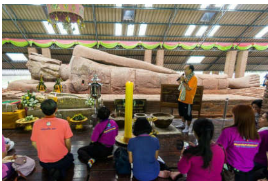
พระนอนหินทราย อ.สูงเนิน

ชุมชนโบราณแถบลำตะคอง เมื่อกว่า 1,300 ปีก่อน เป็นชุมชนสมัยทวารวดีที่นับถือพุทธศาสนา จึงมีหลักฐานของคูน้ำคันดินเมืองเสมา พระนอนหินทรายที่เก่าที่สุดในประเทศไทย และธรรมจักรศิลาหินทราย กับใบเสมาที่แกะสลักจากหินทรายที่บ้านหินตั้งนอกเมืองเสมา เมืองซึ่งคาดว่าเป็นศูนย์กลางของอาณาจักรศรีจนาศะ ต่อมาในสมัยขอมราว 1,000 – 800 ปีก่อน มีหลักฐานของปราสาทหินเมืองแขก-โนนภู-เมืองเก่า ที่ตำบลโคราษของอำเภอสูงเนิน โดยปราสาทหินเมืองแขกจัดเป็นศาสนสถานหินทรายชาวทวารวดีในศาสนาฮินดูหรือพราหมณ์ ใช้ปราสาทในการประกอบพิธีกรรมถวายแด่พระศิวะ ปัจจุบันมีการจัดงานประเพณี “กินเข่าค้ำ” ทุกปี