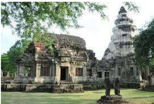
ปราสาทหินพนมวัน ต.บ้านโพธิ์

ช้างดึกดำบรรพ์มากที่สุดในโลกถึง 10 สกุล จาก 55 สกุลที่พบทั่วโลก หรือร้อยละ 18 รวมทั้งสัตว์อื่นๆ เช่น แรด ฮิปโป ยีราฟคอสัน ม้าสามนิ้วฮิปโปเรียน อูรังอุตัง กวางแอนติโลป ซาลิโคเธอร์ หมูใหญ่ เมอร์โคโป-เทมัสควายโบราณ เสือเขี้ยวดาบ ไฮยีนา ตะโขง เต่ายักษ์ เป็นต้น จึงทำให้เกิดเครือข่ายอนุรักษ์และการท่องเที่ยว ทั้งที่พิพิธภัณฑ์ช้างดึกดำบรรพ์ ในตำบลท่าช้าง อำเภอเฉลิมพระเกียรติ พิพิธภัณฑ์ซากดึกดำบรรพ์ ที่ตำบลโคกสูง และโคราชไดโนพาร์คที่ตำบลโคกกรวด อำเภอเมืองนครราชสีมา