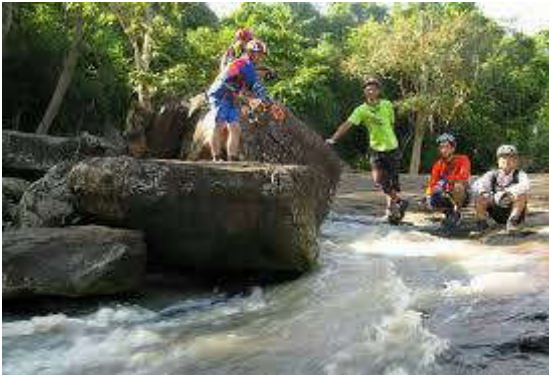
น้ำตกวะภูแก้ว ต.มะเกลือใหม่

ที่สุด หากมีการจัดการที่ดี ด้วยการมีส่วนร่วมจากชุมชนท้องถิ่นกับภาคส่วนต่างๆ ที่เกี่ยวข้อง จะเป็นแหล่งท่องเที่ยวที่มีมาตรฐานและเกิดความยั่งยืนได้