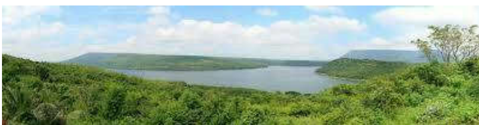
เขาควงสตาหรือเขาอู่ไต้บริเวณประตูสู่ที่ราบสูงโคราช

เนื่องจากลักษณะสำคัญของโคราชจีโอพาร์ค คือ ดินแดนประตูของที่ราบสูงโคราชในพื้นที่ลุ่มน้ำ ลำตะคองตอนกลางถึงตอนล่าง โดยมีสัณฐานภูมิประเทศเด่น คือ เขาควงสตาหรือเขาอู่ไต้ที่เป็นหินทรายกับ ลำตะคองที่เป็นธารน้ำบรรพกาลไหลกัดกร่อนบนพื้นที่หินฐานส่วนใหญ่เป็นหินทราย